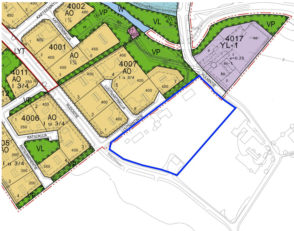
Kuva 2. Ote asemakaavayhdistelmästä ja suunnittelalueen raja.

Suunnittelualueella ei ole ennestään asemakaavaa. Alue rajautuu vuosina 2002 ja 2012 vahvistuneisiin asemakaavoihin, joissa lähiympäristöön on osoitettu asuntoalueita (AO), puistoa (VP) ja julkisten lähipalvelurakennusten korttelialue koulua ja lasten päiväkotiä varten (YL-1) sekä katualueita.